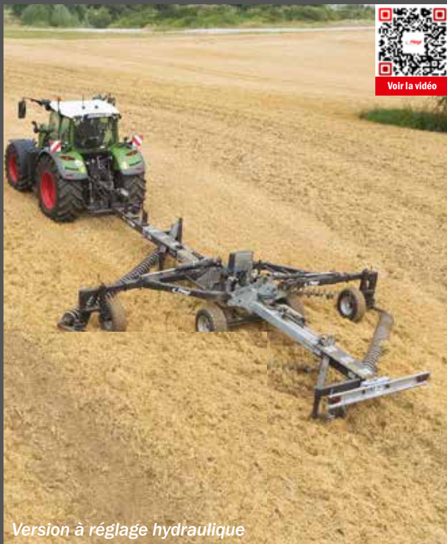
Version à réglage hydraulique

Un appareil aux multiples avantages. Cette manière inhabituelle de travailler le sol séduit par ses avantages de taille !